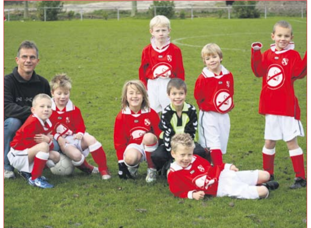
Shirtsponsor jeugdteam

Sponsors zijn zeer belangrijk voor verenigingen. Gelukkig beschikt v.v. Rhoon al jaren over een grote groep trouwe sponsors die v.v. Rhoon een warm hart toe dragen en die v.v. Rhoon steunen door dik-en-dun.